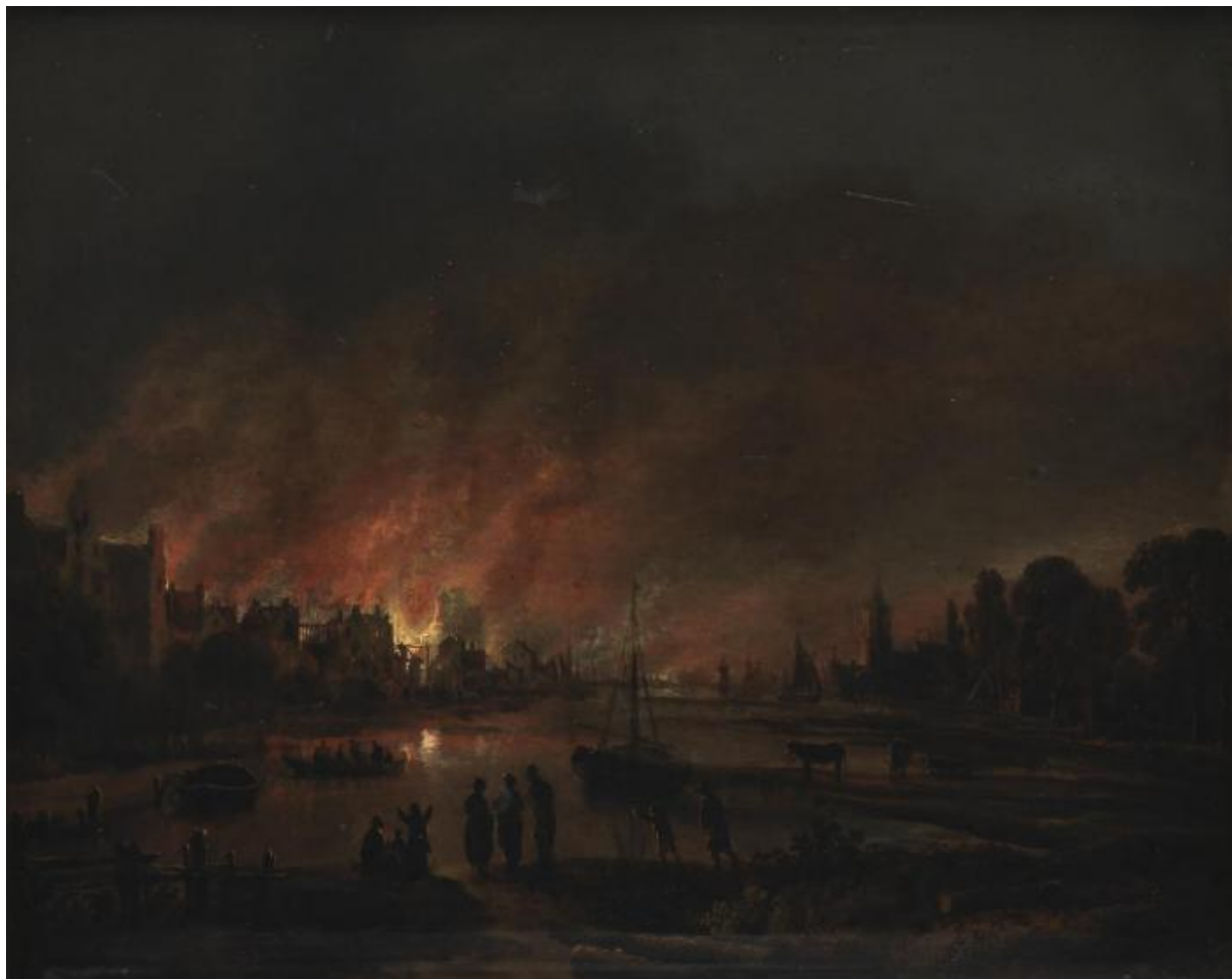
Fig. 20 Aert van der Neer: Nattlig ildebrand i en landsby . Udateret. Olie på træ. 36,5 x 45,5 cm. Statens Museum for Kunst, København, inv. nr. KMSsp448.