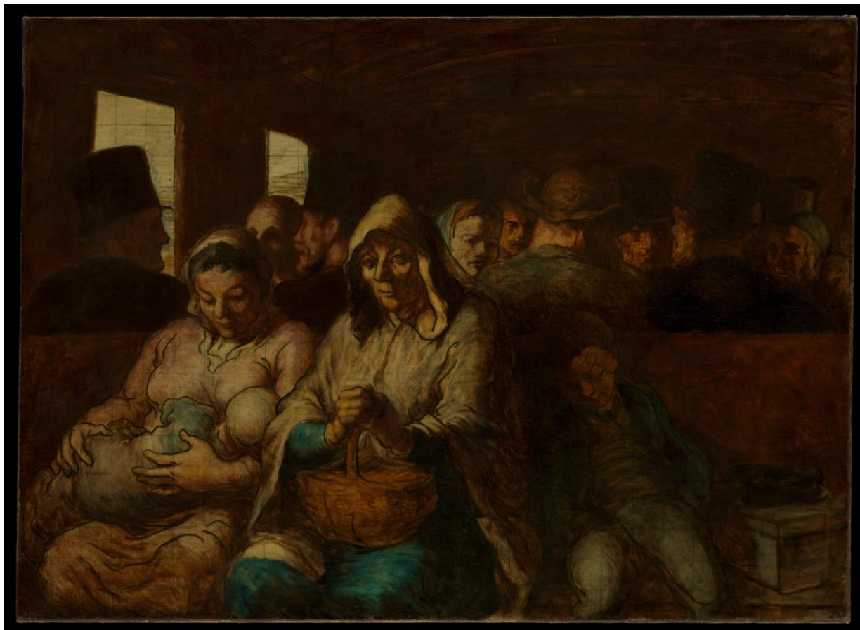
Fig. 13 Honoré Daumier: Tredjeklassesvogn. (ca. 1862-64). Olie på lærred. 65,4 x 90,2 cm. Metropolitan Museum of Art, New York, inv. nr. 29.100.129.