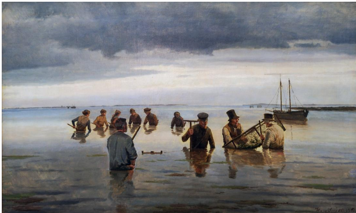
Fig. 27 Hans Smidth: Glibfiskere . 1915. Olie på lærred. 84 x 140 cm. Museum Salling (Skive Museum), Skive, inv. nr. 176v0003.

Det stemningsfulde maleri, Glibfiskere , [fig.27] fra 1915 hører til blandt Smidths sidste malerier. 46 I takt med at farvepaletten får mere lys og luftighed, bliver penselstrøgene ligeledes bredere og lagt på med en yderst sikker hånd, hvilket maleriet med glibfiskerne i særdeleshed illustrerer. Denne mere umiddelbare maleteknik bidrager med en friskhed og et nærvær, der styrker Smidths mere enkle kompositioner.