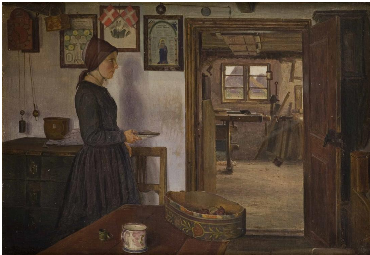
Fig. 2 Hans Smidth: Stue. Fjends Herred . (1860'erne). Olie på lærred. 31,2 x 44,1 cm. Den Hirschsprungske Samling, København, inv. nr. 466.