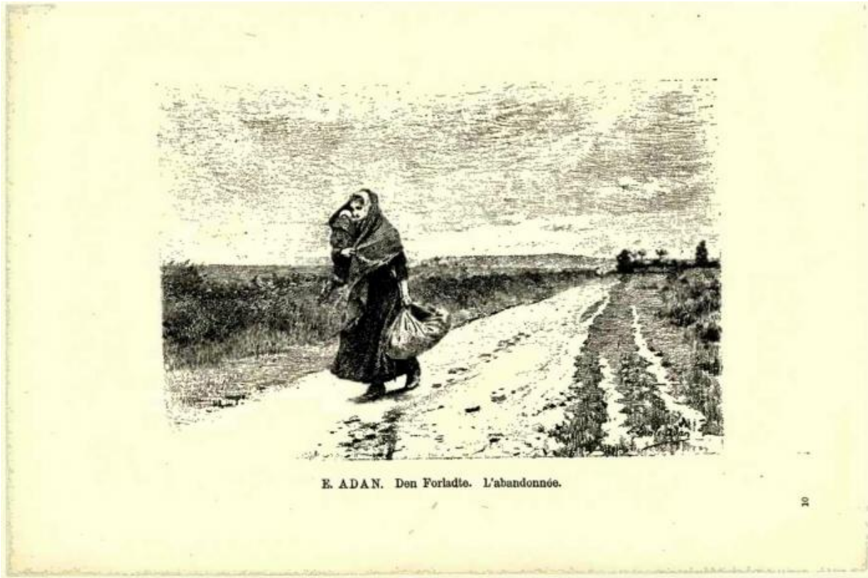
Fig. 14 Fra "Illustreret katalog over udstillingen af franske kunstværker i københavn 1888", F. Hendriksen (værksted) grafik efter forlæg af Louis-Émile Adans værk L'abandonnée fra udstillingen.