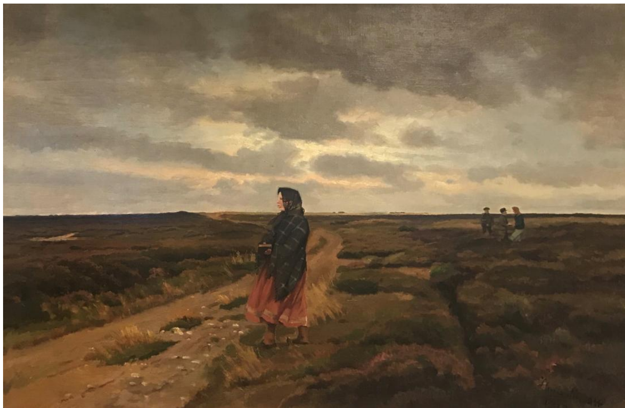
Fig. 16 Hans Smidth: Skolebørn på heden . 1913. 79,5 x 119,5 cm. Skive Folkeblad, Skive.

Det golde landskab og den lange, tomme sti ses også i Smidths maleri fra 1913, Skolebørn på heden [fig.16], der ligeledes bærer en kompositorisk lighed med Adans maleri. Til trods for at det ikke kan dokumenteres, at Smidth så den franske udstilling, er sandsynligheden for, at han så det illustrerede udstillingskatalog og heri illustrationen af Adans maleri stor. Smidths udaterede maleri af Taterkvinden kan formodes at være malet umiddelbart efter 1888 eller i 1890'erne, hvor Smidth særligt arbejdede med dette radikale motiv af taterne.