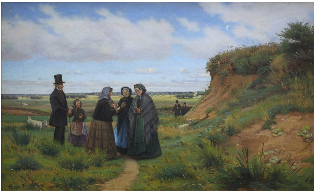
Fig. 8 Hans Smidth: Bondefolk i søndagsklæder på hjemvej fra kirken. udateret. Olie på lærred. 52 × 83,5 cm. Museum Salling (Skive Museum), Skive, inv. nr. SKA 176v0081.Maleriet er oprindeligt registreret som "udateret", men formodes at være fra ca. 1878.