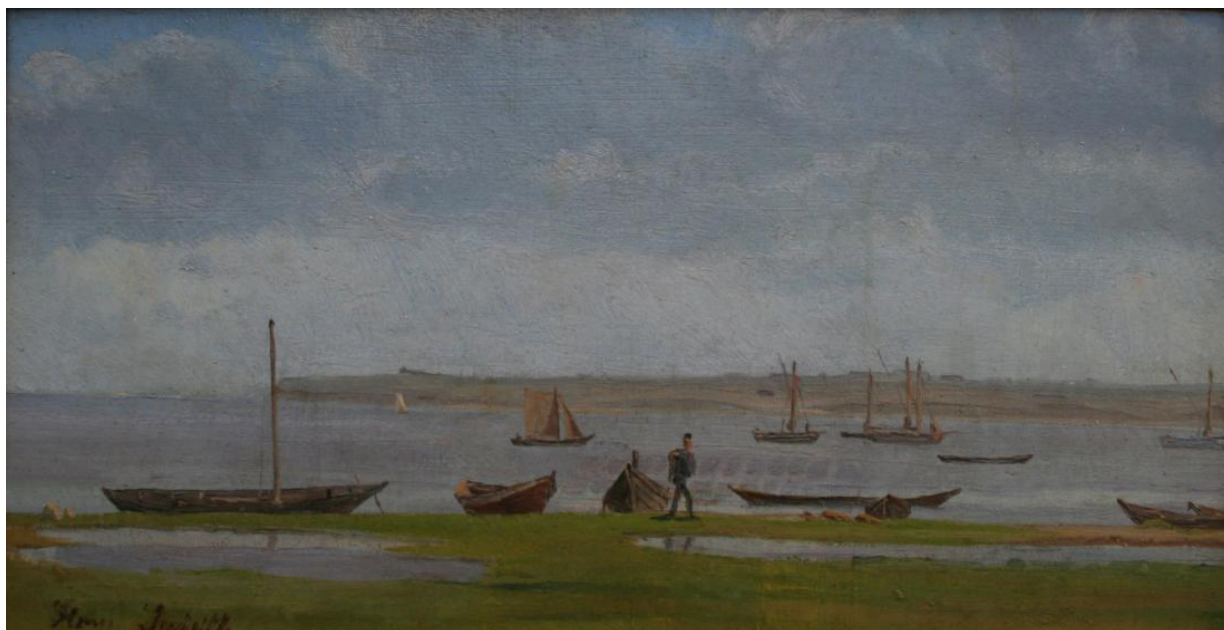
Fig. 4 Hans Smidth: Ved Skive fjord. Udsigt mod Staarup , (ca. 1860). Olie på papir opklæbet på træ. 14 x 26,5 cm. Museum Salling (Skive Museum), Skive, inv. nr. SKA 176v0014.

Sammen med en tiltagende dyrkelse af lyset følger der også med årene friere penselstrøg, der ikke karakteriserer malerierne fra de tidlige år i 1860'erne. Maleriet af stuen er blandt de sjældne gennemarbejdede værker fra perioden, der er malet på lærred. Størstedelen af kunstnerens arbejder efter hjemkomsten til Skive er malet på pap, der blev præpareret med lim, da der ikke var råd til lærred. Valget af bundmateriale kan således bidrage til at datere de tidligere værker. Dog er dette forhold også grunden til, at tidlige værker fra kunstnerens hånd er sjældne, da limen bevirkede, at papiret med tiden knækkede og motivet smuldrede væk. 18 De lette og billige materialer havde imidlertid den fordel, at de gav kunstneren mulighed for at vandre rundt og male studier foran sit motiv som eksempelvis det lille værk på pap Ved Skive fjord. Udsigt mod Staarup [fig.4], der ligeledes må formodes at være fra 1860'erne.