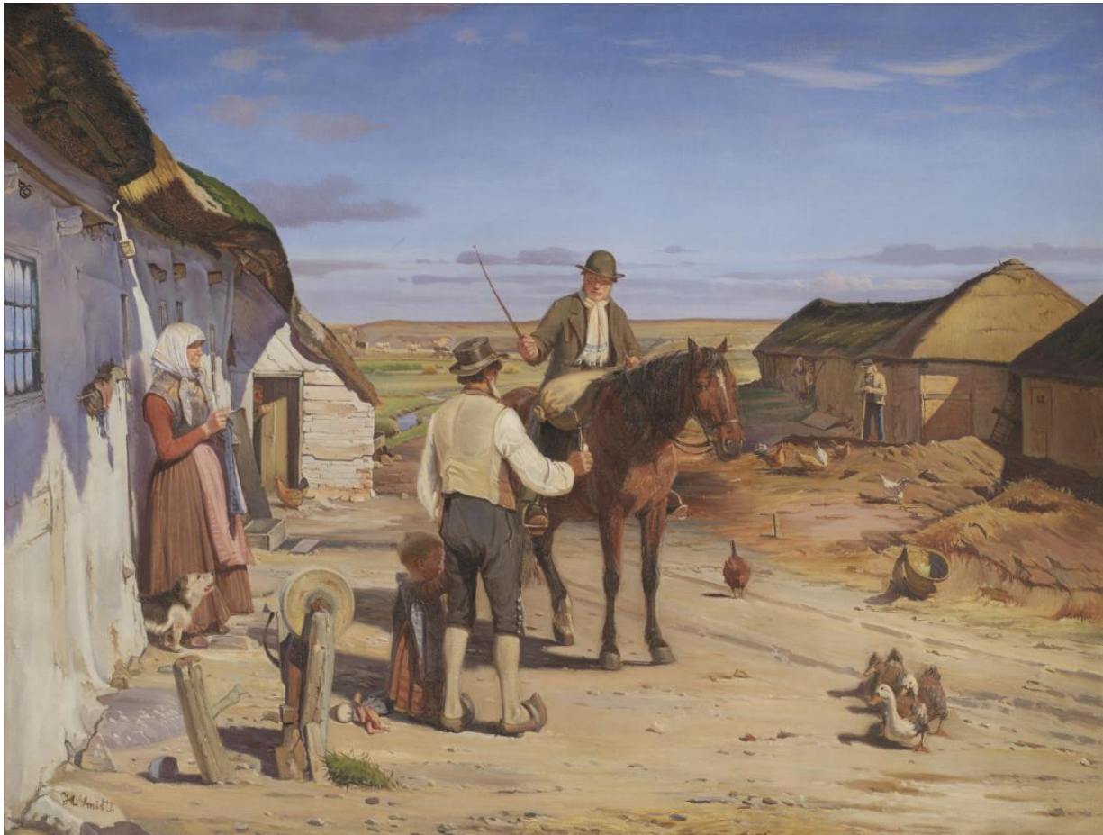
Fig. 6 Hans Smidth: En fremmed spørger om vej i bondegården på heden . 1877. Olie på lærred. 76,5 x 100 cm. Statens Museum for Kunst, København, inv. nr. KMS1693.

fra Skive, der allerede på dette tidspunkt var en gård med flere generationer bag sig. Maleriet er stilistisk blevet sammenlignet med værker af nationalromantikerne Dalsgaard, Roed og Jørgen Sonne (1801-1890). 23