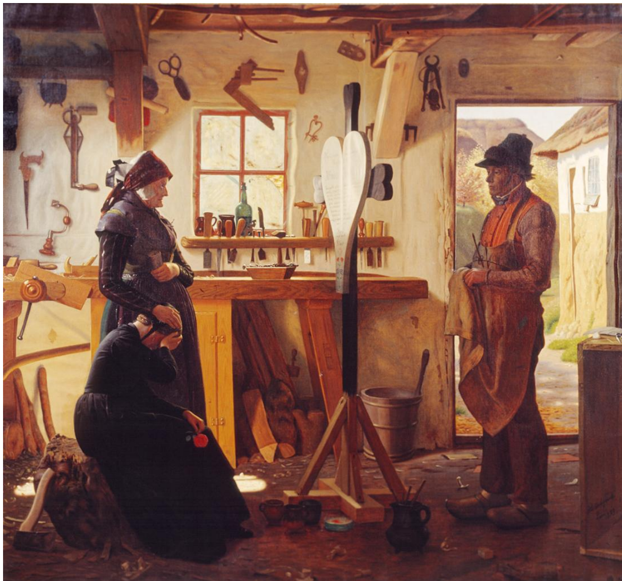
Fig. 3 Christen Dalsgaard: To kvinder besøger landsbykunstneren for at se det bestilte gravkors , 1873. Olie på lærred. 97,5 x 105,5 cm. Statens Museum for Kunst, København, inv. nr. KMS1752.

tvivlsomt, at de to kunstnere nogensinde kom til at lære hinanden at kende. Dog er det alligevel relevant at dvæle ved en sammenstilling mellem de to kunstnere, der på mange måder har et motivisk slægtskab i skildringen af det jyske folkeliv. Dalsgaard står som en af de væsentligste repræsentanter af det nationalromantiske genremaleri og var stor tilhænger af Høyen. Fortællingen figurerer som et grundelement i Dalsgaards malerier, der oftest understreges af lange og beskrivende titler, der underbygger de følelsesladede og tragiske skæbneberetninger. [fig.3]