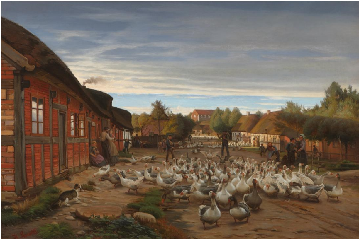
Fig. 5 Hans Smidth: Flokke af gæs drives gennem Ry . 1879. Olie på lærred. 85 x 126 cm. Museum Salling (Skive Museum), Skive, inv. nr. SKA 176v0050.

Smidth vinder ikke hovedpræmien for sit maleri med gæssene men opnåede alligevel at få en ekstrabelønning for arbejdet. Derudover skabte han et utal af skitser og studier af gæs, der sikrede denne fugl en plads i Smidths malerkunst igennem resten af karrieren. Således ses gæssene blandt mange andre motiver blive taget op igen i 1879 i maleriet, Flokke af gæs drives gennem Ry [fig.5] samt i Landskab med gæs, køer og mælkejunger [fig.28], som vil blive behandlet senere i artiklen.