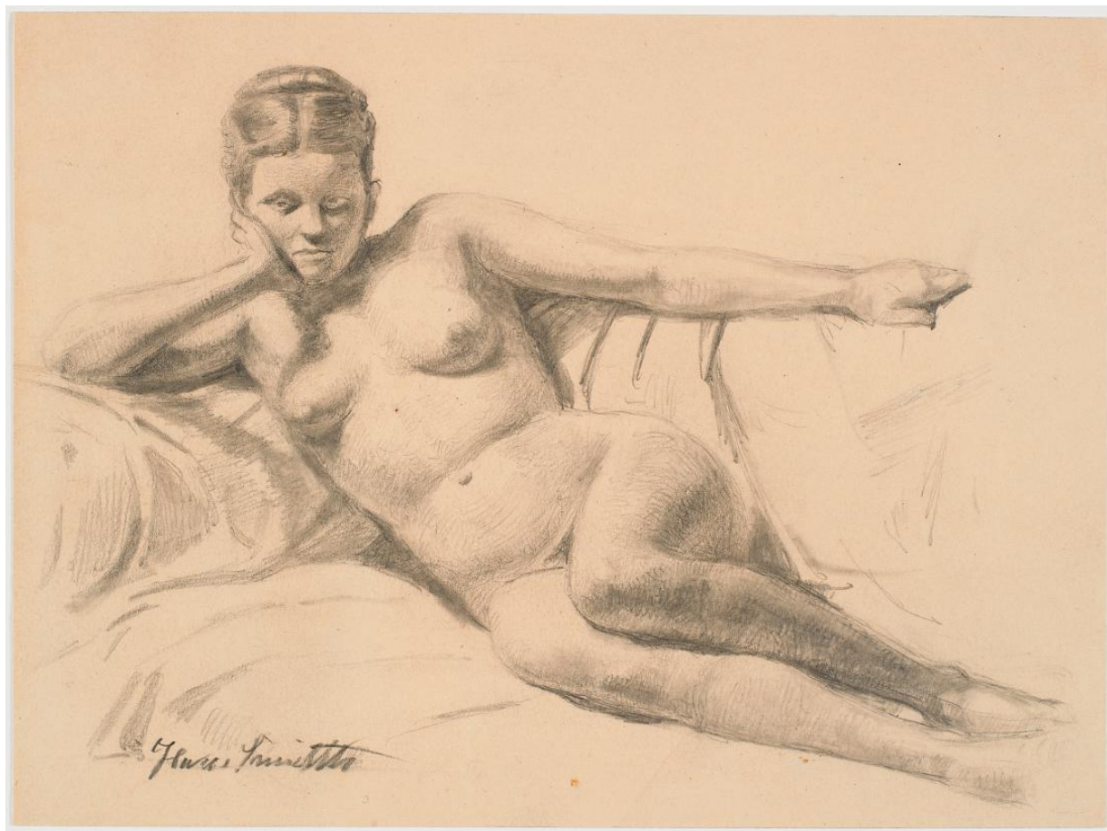
Fig. 1 Hans Smidth: Liggende kvindelig model . (1860'erne). Blyant på papir. 177 x 238 mm. Den Kgl. Kobberstiksamling, Statens Museum for Kunst, København, inv. nr. KKS13384. Foto: Public Domain