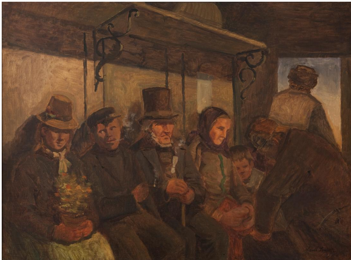
Fig. 12 Hans Smidth: I en tredje classes jernbanekupé . 1887. Olie på lærred. 72,5 x 97,5 cm. Statens Museum for Kunst, København, inv. nr. KMS3666.

direkte som [L.A.] Ring det sjællandske.” 34 Nørregård-Nielsen dvæler dog ved Smidths tilbageholdne subjektive tilgang: ”Hans Smidth afmalede, hvad han så; jeg siger ikke, han gjorde det uden følelse, så langt fra, men der ligger i hans billeder hverken nogen lovprisning af det svindende eller en afstandtagen til det kommende.” 35 Det diffuse forhold mellem det subjektive og objektive i Smidths kunst bidrager til, at han stilmæssigt er svær at placere ét sted. Dog er hans engagement i sine virkelighedsnære motiver af landskabet, jyske bønder, fattigfolk, tatere og eksistenser fra andre samfundslag væsentlig i forhold til den primære kobling til realismen.