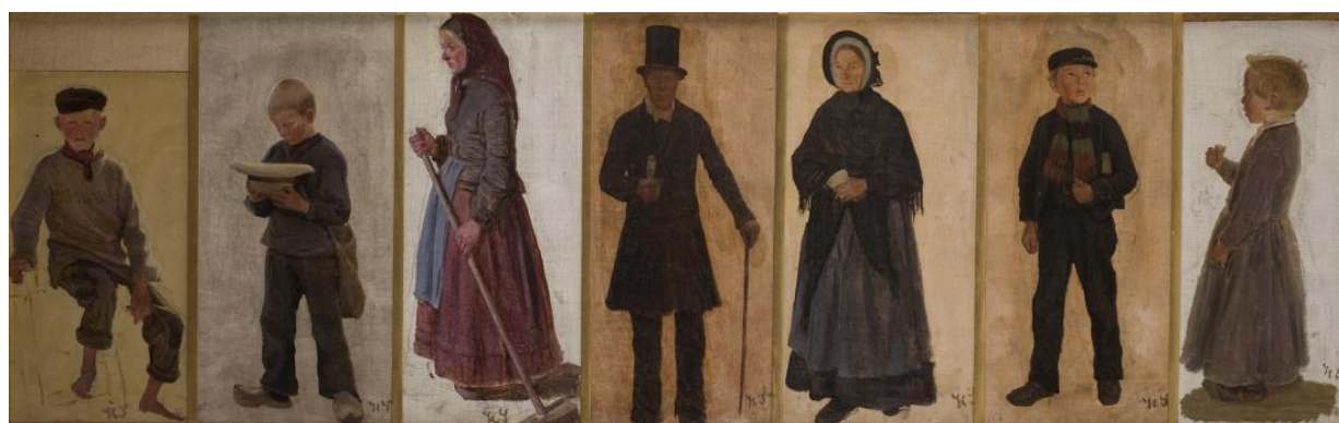
Fig. 11 Hans Smidth: Syv figurstudier, monteret på et lærred . (1870'erne). Olie på papir. 31,6 x 99,7 cm. Den Hirschsprungeske Samling, København, inv. nr. 473.

Maleriet, Bondefolk i søndagsklæder på hjemvej fra kirken kan ydermere betragtes som en nøgle til en hidtil uudforsket relation mellem Smidth og familien Ancher.