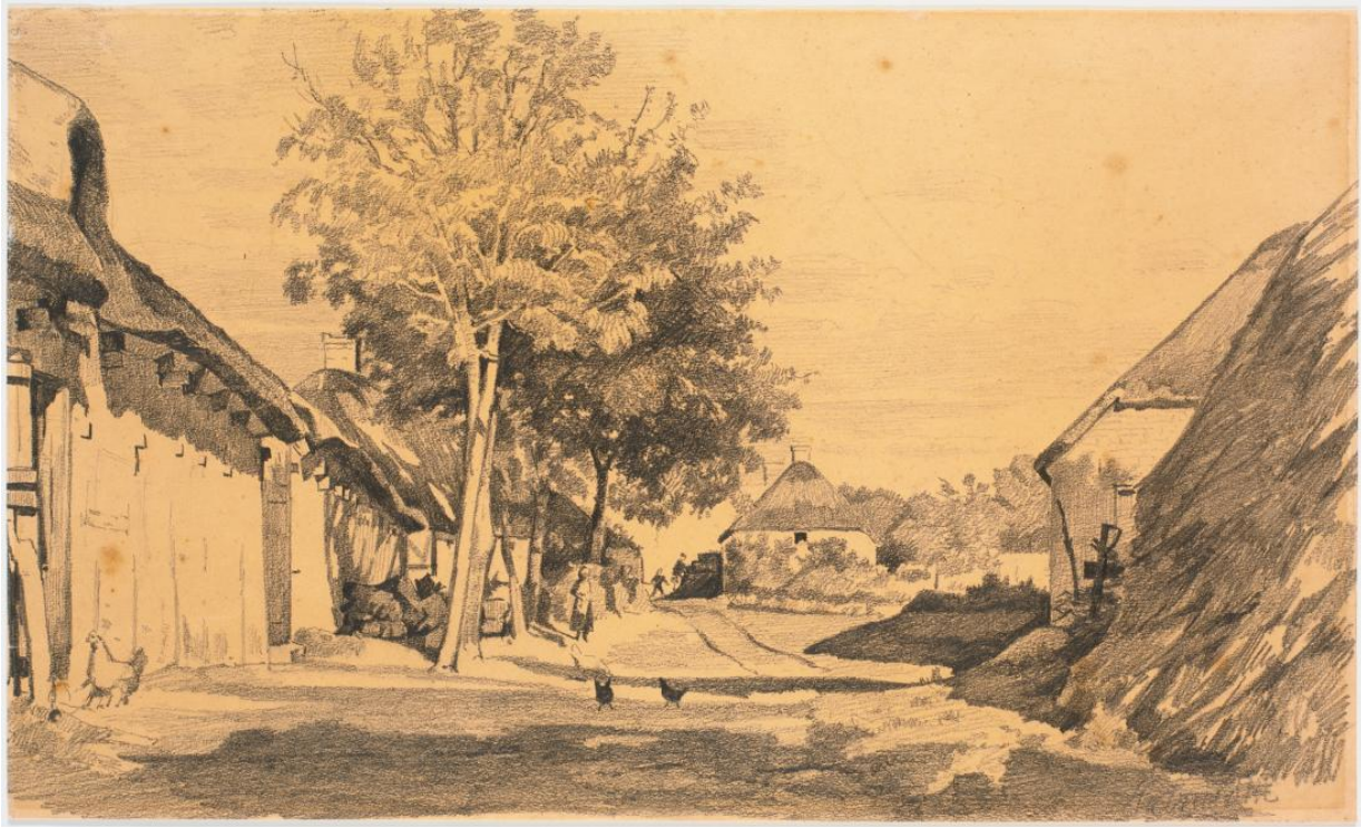
Fig. 7 Hans Smidth: Landsbygade i sol. (efter 1900). Blyant på papir. 225 x 375 mm. Den Kongelige Kobberstiksamling, Statens Museum for Kunst, København, inv. nr. KKS9525.