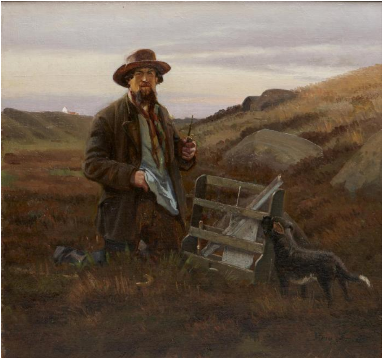
Fig. 17 Hans Smidth: Gfarmesteren på heden . (ca. 1890). Olie på lærred. 43 x 46 cm. Museum Salling (Skive Museum), Skive, inv. nr. SKA 176v0001.

heller ikke præg af en fremmedhedsfølelse over for dette folkefærd.