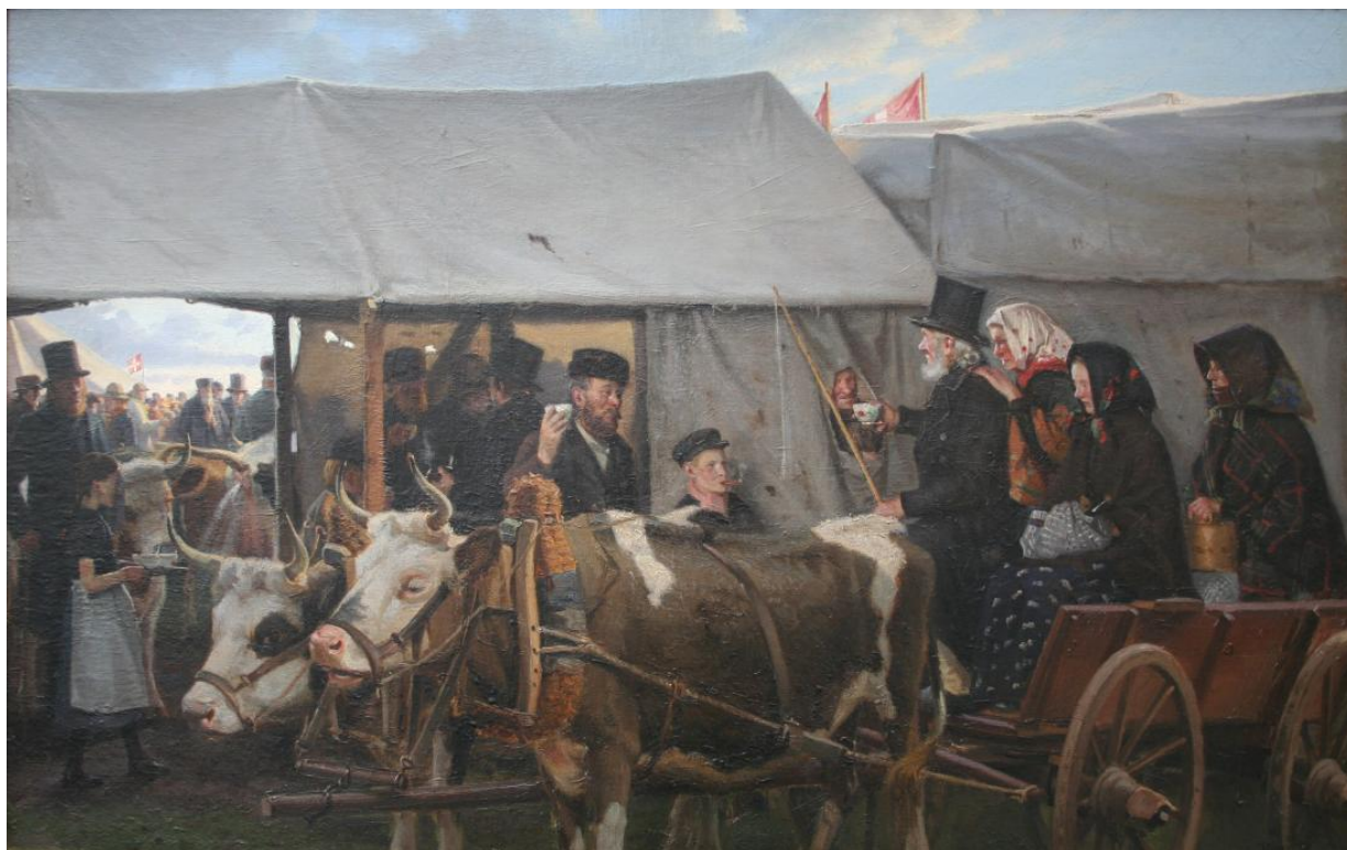
Fig. 24 Hans Smidth: Markedsscene . 1894. Olie på lærred. 61 x 97 cm. Museum Salling (Skive Museum), Skive, inv. nr. SKA 176v0004.

Maleriet viser, hvordan Smidth nu mestrer tegningen og de maleriske teknikker. Billedfladen er fyldt ud, og man fornemmer dynamikken i både for-, mellem- og baggrund. Markedsscenens festlige stemning er yderst nærværende og levende, og de små detaljer dukker ustandseligt frem på lærredet. Maleriet er nærmest som et øjebliksbillede fra en ufiltreret virkelighed. Hvad der ydermere understreger dette, er koen i mellemgrundens venstre side [fig.25].