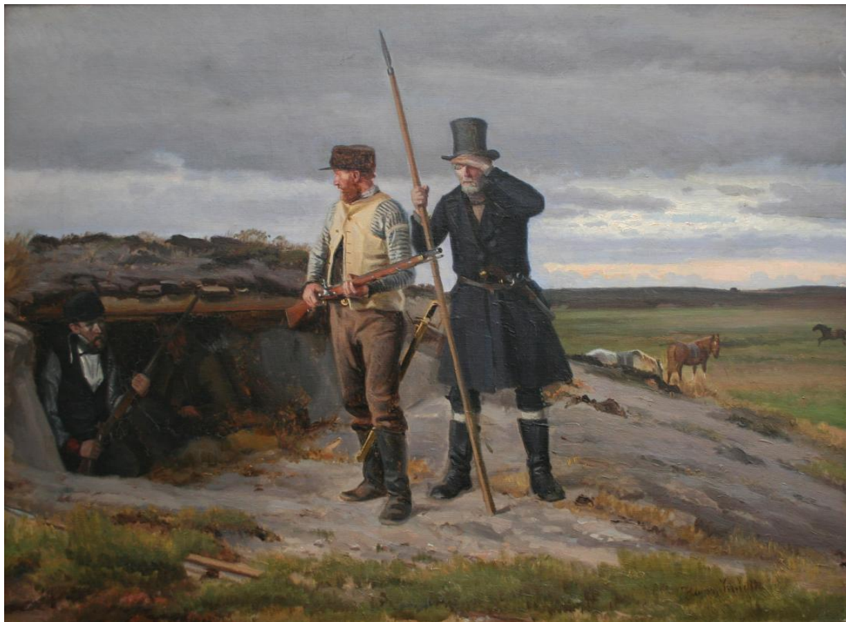
Fig. 23 Hans Smidth: En Udsigtspost . (Ca. 1894). Olie på lærred. 59 x 80 cm. Museum Salling (Skive Museum), Skive, inv. nr. SKA 176v0006.

Historien lød, at tugthusslaver fra Rendsborg var sluppet løs og bevægede sig op igennem Jylland, hvilket gjorde, at bønder i frygt stimlede sammen med hjemmelavede våben. Der var dog ingen slaver på flugt, så det må formodes, at det ikke har været helt uden humor, Smidth har skildret de dramatiske og tragikomiske scener. Alligevel fornemmer man bøndernes alvor i malerierne. Smidths bud på historiemaleriet med slavekrigsmotivet, bemærker Hornung da også, er "et tilpas stilfærdigt og begivenhedsløst emne for Hans Smidth." 43 For Smidth har det måske nærmere været fascinationen af figurstudiet og bøndernes dragter og uniformer, der har motiveret ham til at male dette motiv, hvilket nærmest giver det karakter af et genremaleri.