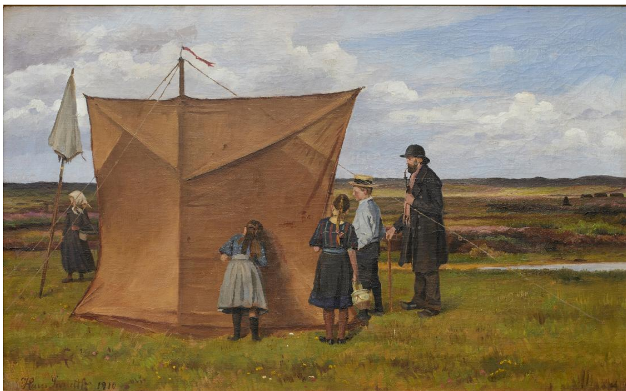
Fig. 26 Hans Smidth: Nysgerrige ved malerteltet . 1910. Olie på lærred. 40 x 64 cm. Museum Salling (Skive Museum), Skive, inv. nr. 176v0045.

Smidths store gennembrud kom i år 1900, hvor Kunstforeningen i København, ført an af kunstneren August Jerndorff (1846-1906), arrangerede en stor retrospektiv udstilling med omkring 300 af Smidths studier og tegninger. Stort set alle værker blev solgt på udstillingen, herunder flere til tobaksfabrikanten og kunstsamleren, Heinrich Hirschsprung, hvilket også smittede af på den efterfølgende salgbarhed af hans kunst. Smidth bliver tildelt Eckersberg Medaljen både i 1905 og i 1906, hvor han ligeledes høster anerkendelse, da han bliver medlem af Akademiets Plenarforsamling. Denne opsigtsvækkende påskønnelse må have givet en fornyet energi og ikke mindst kunstnerisk selvbevidsthed, hvilket fik iøjnefaldende betydning for dateringen af Smidths værker. Selvom dateringerne på ingen måde er hyppige eller konsekvente, kan det konstateres, at størstedelen af de malerier, der findes med datering, er skabt efter 1900. Det nye blik på sig selv som en anerkendt kunstner kommer også til udtryk i flere selvportrætter fra de sene år, herunder fra 1905, 1910 og 1916. 45