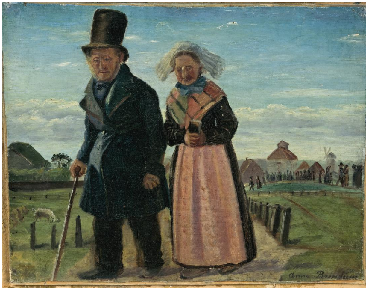
Fig. 9 Anna Ancher: Et gammelt ægtepar på hjemvejen fra Skagen Kirke efter en begravelse , 1878, olie på lærred på pap, 24,7 x 32,2 cm, Skagens Kunstmuseer, Skagen, inv. nr. 261.

Maleriet Bondefolk i søndagsklæder på hjemvej fra kirken [fig.8] hører til blandt de mange udaterede malerier af Smidth. Dog er der flere grunde til, at en fastsættelse af dateringen kan knyttes til slutningen af 1870'erne. I denne periode har kunstneren en særlig interesse for folkelivsskildringer og figurstudier som gennemgået i afsnittet ovenfor. Dertil kommer også, at maleriets titel har slægtskab med den titel, der findes i kataloget fra Forårsudstillingen på Charlottenborg i 1878, der lyder: En Søndag-Eftermiddag i Efteraaret. Folk gaae fra Kirke. Motivet fra Vestjylland.