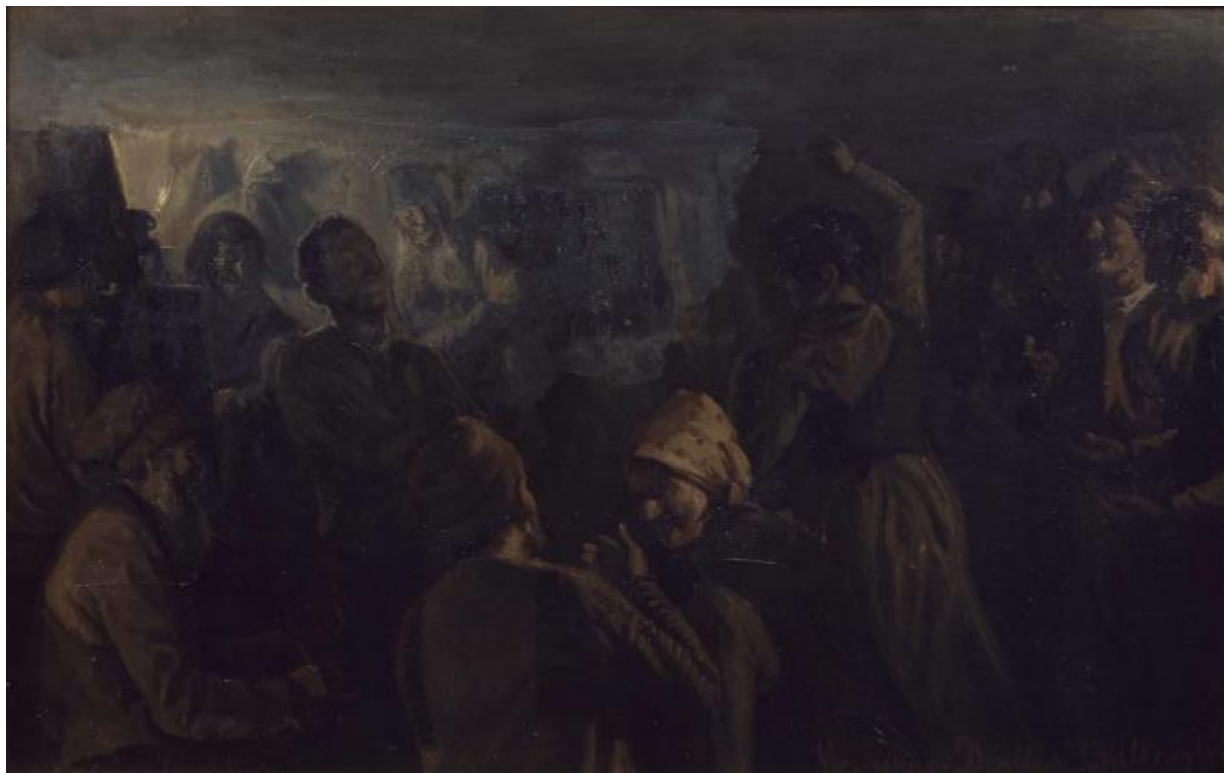
Fig. 19 Hans Smidth: Pennekas Drallers Kjeltringbal . 1894. Olie på lærred. 61,3 x 96,5 cm. Den Hirschsprungske Samling, København, inv. nr. 479.

Smidths skildringer beskrives som værende "saa ægte jydsk i Sind og Skind, som Blichers Text krævede det." 40 Den såkaldte "nederlandske pensel" formodes Smidth at have tilegnet sig i disse år sig ved at lade sig inspirere af den hollandske maler, Aert van der Neers (1603-1677) mørke måneskins- og ildebrandsbilleder, som Smidth kunne opleve i Den Kongelige Malerisamling. [fig.20] Smidth har øjensynligt også brugt denne inspirationskilde i sine senere malerier af ildebrande, som han malede fra 1910 og frem til sin død. Kunstnerens interesse for farver og lys kommer her til udtryk på en ny måde med mørke farver og et kraftigt clairobscur. I maleriet Ildebrand [fig.21] fornemmes livets barske vilkår, hvor bønderne sidder i studevognen som stille tilskuere til en voldsom ildebrand, der oplyser den mørke himmel.