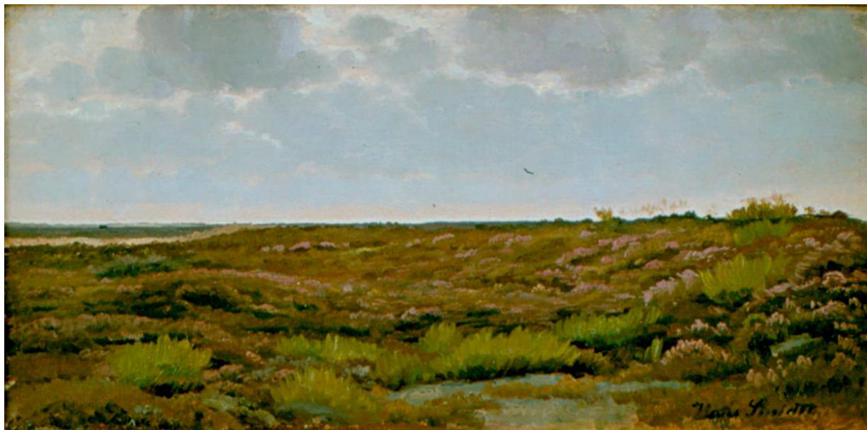
Fig. 22 Hans Smidth: Blomstrende lyng i hedelandskab . (ca. 1910). Olie på lærred. 26,5 x 51,5 cm. Museum Salling (Skive Museum), Skive, inv. nr. SKA 176v0015.