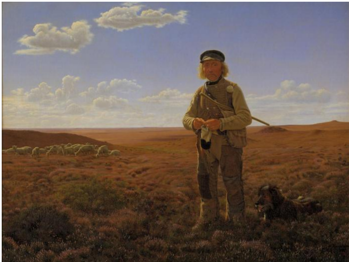
Fig. 18 Frederik Vermehren: En jysk fårehyrde på heden . 1855. Olie på lærred. 59,5 x 80 cm. Statens Museum for Kunst, København, inv. nr. KMS1496.

Denne identifikation anvender Smidth også, da han laver illustrationer til St. St. Blichers (1782-1848) noveller i 1890'erne. Blicher vandrede også rundt i den jyske hede generationer før Smidth, så kunstneren var på flere måder den rette til at være Blichers efterspurgte "nederlandske Pensel" til at skildre "denne nederlige Scene" 39 i Pennekas Drallers Kjeltringbal fra 1894. [fig.19]