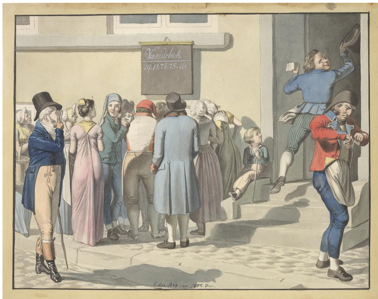
Fig. 7. C.W. Eckersberg: Udenfor Tallotteri-Kollektionen . 1808. Blyant, pen, sort blæk og vandfarve. 251 x 314 mm. Den kgl. Kobberstiksamling, SMK, inv.nr. KKSgb4034.

Eckersberg interesserede sig åbenlyst for emnet, for han har også tegnet andre lotteriscener, blandt andet en hvor vindere og tabere gør hver sin grimasse. [fig.7] Mest interessant er måske herren med lorgnetten, som spotter vinderen i flokken. Den elegante laps har en fætter i Lotterisedlen , nemlig i tredje blad, hvor skomageren har vundet. Snylteren melder sig straks for at rådgive den pludseligt velhavende dåre, og vi som ser til, kan gætte på, hvad der siden vil komme.