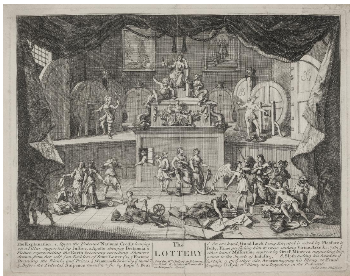
Fig. 9. William Hogarth: Lotteriet , 1721. Radering og kobberstik. 262 x 338 mm. Den kgl. Kobberstiksamling,