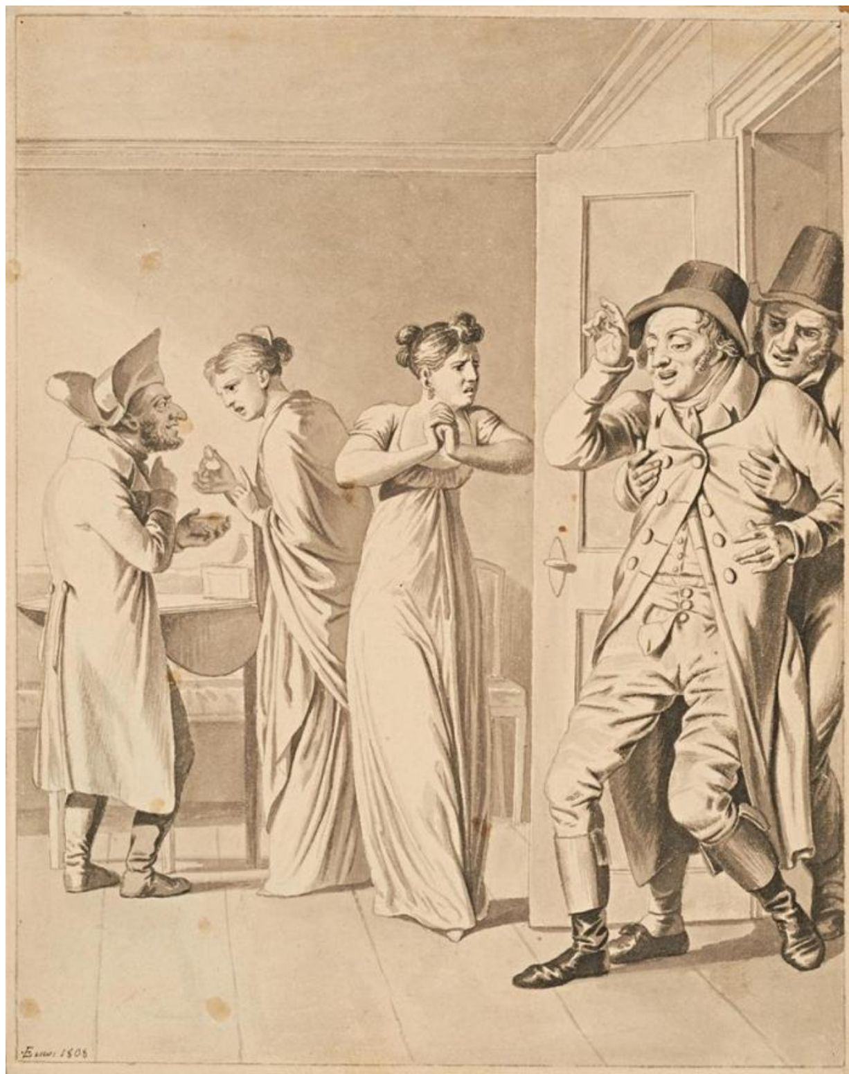
Fig. 8. C.W. Eckersberg: Lotterisedlen V. Aftagelse i velstand . 1808. Tusch med pensel. 280 x 222 mm. Den Hirschsprungske Samling, inv.nr. DHS691.

Napoleon stadfæstede den emancipation af de franske jøder, som revolutionen havde bragt med sig i 1791, og overalt hvor han kom frem, fik jøderne bedre forhold blandt andet med afskaffelsen af de ghettolove, der bød jøderne at bo bestemte steder og holde sig inde om natten. 23 Da den østrigske kejser Franz I (1768-1835) i 1806 bad sin ambassadør i Frankrig, fyrst Klemens von Metternich (1773-1859) om at rapportere om situationen, fortalte Metternich, at jøderne betragtede Napoleon som en messias, der endelig ville befri dem. 24 Det er muligt, at pantelåneren sender en hilsen til