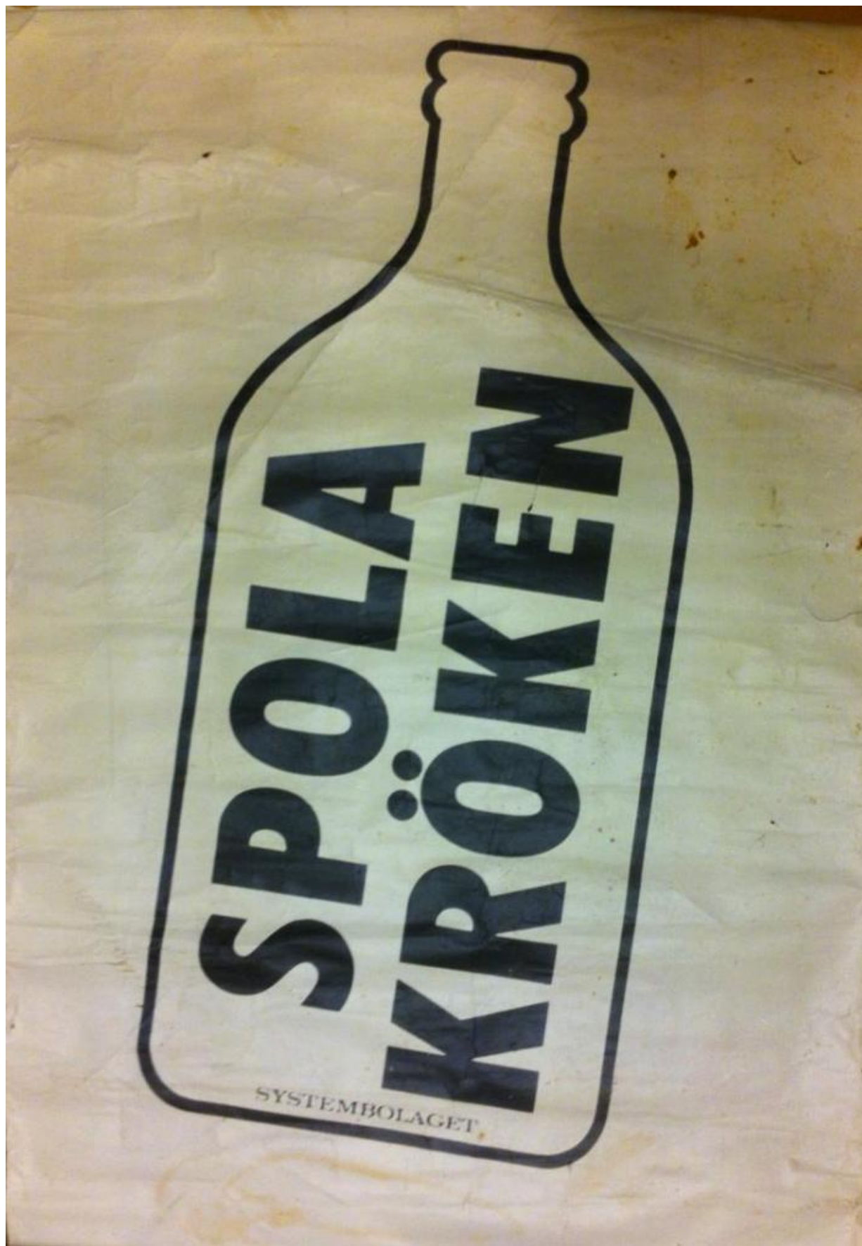
Fig. 1. Oplysningsplakat af Systembolaget fra midt-1970'erne. Copenhagen Fluxus Archive, Statens Museum for Kunst (dep.).