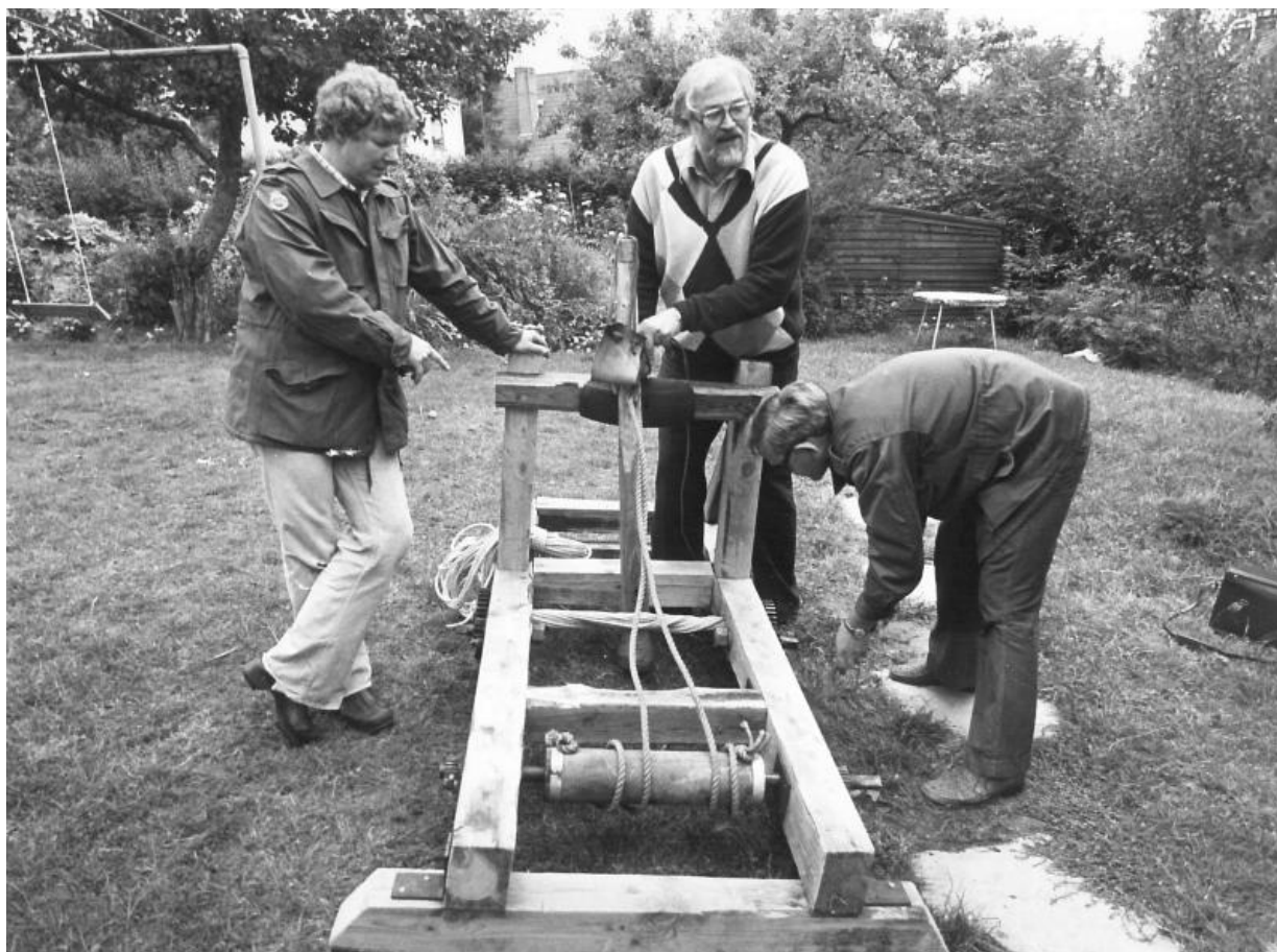
Fig. 4. Hjemmeværnsfolk i gang med at demonstrere bliden, 1976.