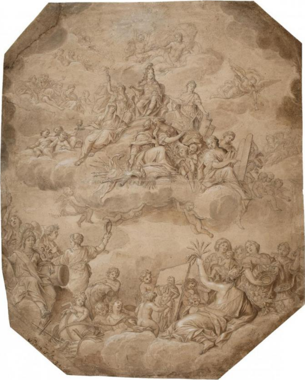
Fig. 7. Magnus Berg: Christian 5.'s apoteose . Pen og sort blæk, brun lavering, forhøjet med hvidt. 639 x 515 mm. Den kgl. Kobberstiksamling, KKSgb8759. Købt med J.C. Spenglers samling i 1840. Statens Museum for Kunst, public domain , SMK .

Spenglers danske samling omfattede mere end 1.700 blade og var anlagt som et historisk overblik over knap tre hundrede års tegnekunst, fra Melchior Lorck [bl.a. fig. 6] til C.W. Eckersberg. 26 Samlingen glimrer ikke alene ved sit omfang men også ved sin gennemgående høje kvalitet og ved det repræsentative udvalg af især 1700-tallets kunst. Særligt påfaldende var samlingens mange store blade som eksempelvis Jacob Conings parti af haven bag Charlottenborg, Magnus Bergs Christian 5.'s apoteose [fig. 7] eller Peder Als' smukke portrætstudier. 27 [fig. 8]