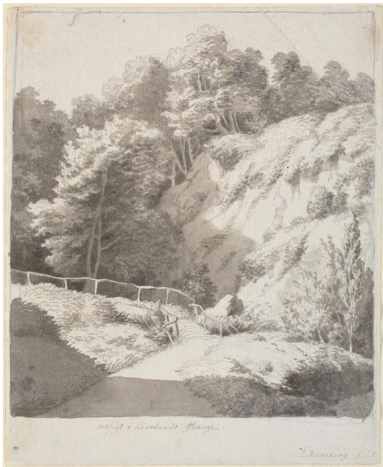
Fig. 2. C.W. Eckersberg: Udsigt i Liselunds have . Ca. 1809. Blyant, pen og blæk samt lavering. 191 x 155 mm. Den kgl. Kobberstiksamling, KKSgb4042. Købt til Kunstakademiet på Johan Bülow's auktion i 1829; overdraget til Den kgl. Kobberstiksamling i 1845. Statens Museum for Kunst, public domain , SMK .

bibliotekets chef, gehejmestatsminister Ove Malling (1748-1829), og havde i Werlauffs øjne den fordel, at biblioteket rimeligvis skulle kompenseres økonomisk af akademiet. I 1828 åbnedes derfor officielt forhandlinger med Kunstakademiet om salg af samlingen. 15