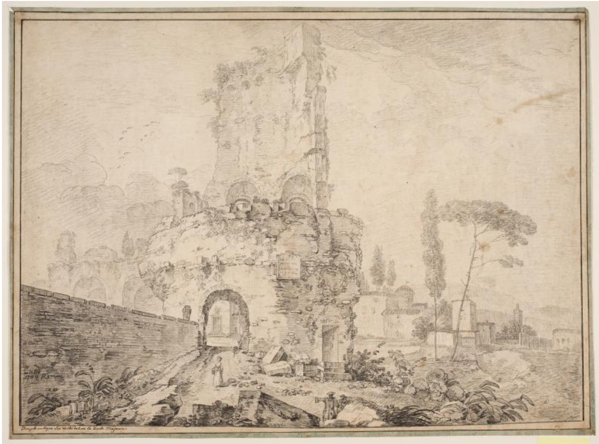
Fig. 4. J.P. Lund: Landskab med ruiner udenfor Rom . 1764. Blyant og sortkridt. 430 x 581 mm. Den kgl. Kobberstiksamling, KKSgb8698. Købt til Kunstakademiet på J.F. Clemens' auktion i 1832; overdraget til Den kgl. Kobberstiksamling i 1845.

samlingens udskillelse fra Det kgl. Bibliotek endelig vedtaget. 21 Selvom tankerne om samlingernes overdragelse til Kunstakademiet dermed var skrinlagt, kunne akademiet med rimelighed stadig anse sig som potentiel hovedsamling for dansk tegnekunst. Akademiet fortsatte derfor en tid med at indkøbe danske tegninger, og på kobberstikker J.F. Clemens' auktion den 1. maj 1832 indkøbtes således en gruppe gode tegninger af J.P. Lund, Abildgaard, Clemens, Juel og andre, 22 [fig. 3-4] Inden årtiets udgang var Kunstakademiet dog også på dette punkt blevet sejlet agterud.