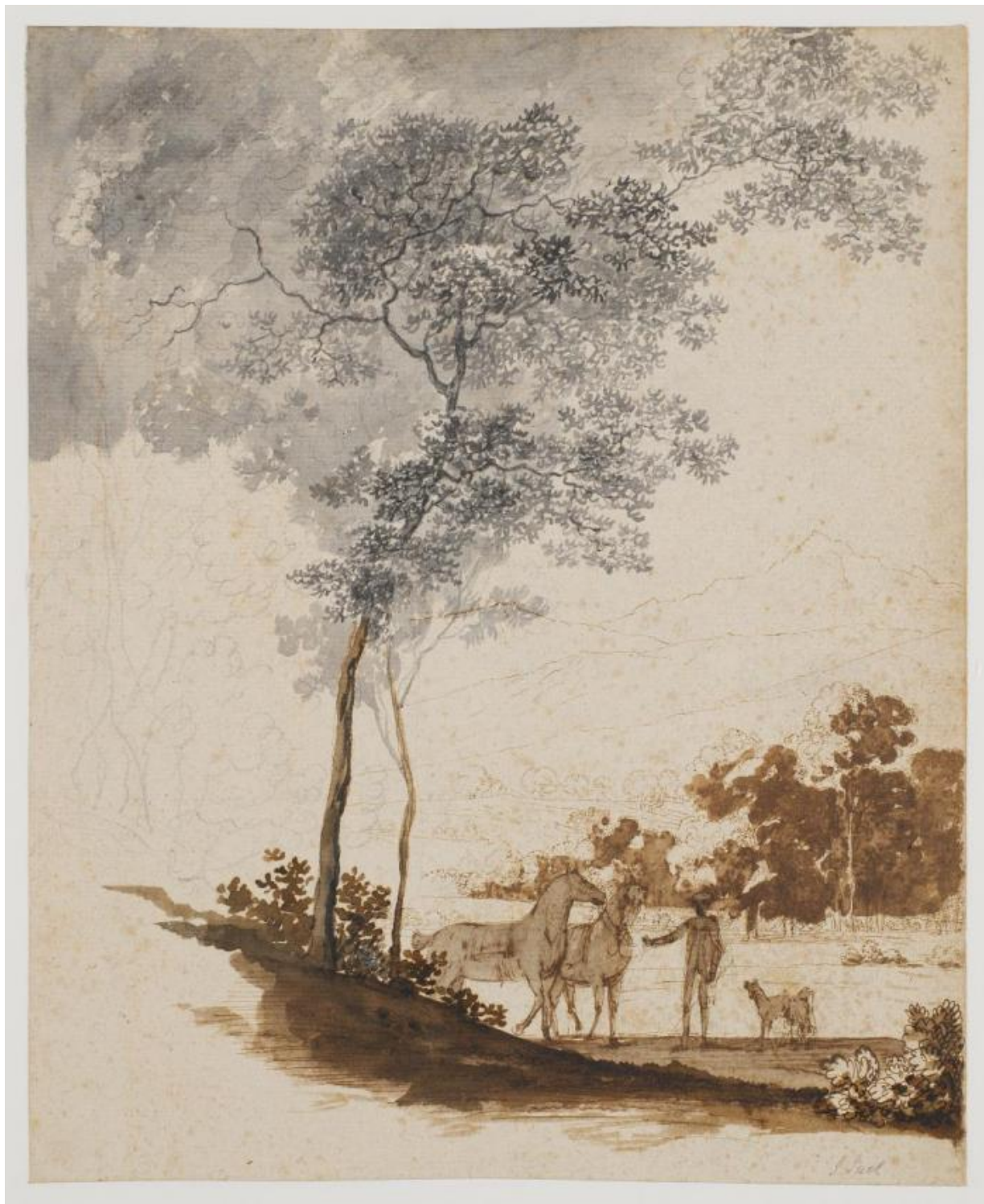
Fig. 9. Jens Juel: Schweizerlandskab med en rideknægt holdende to heste og et par hunde; studie til portræt af Jean-Armand Tronchin . Ca. 1779. Sortkridt, pen og blæk samt tuschlavering på grunderet papir. 347 x 285 mm. Den kgl. Kobberstiksamling, KKSgb5356. Købt med J.C. Spenglers samling i 1840.