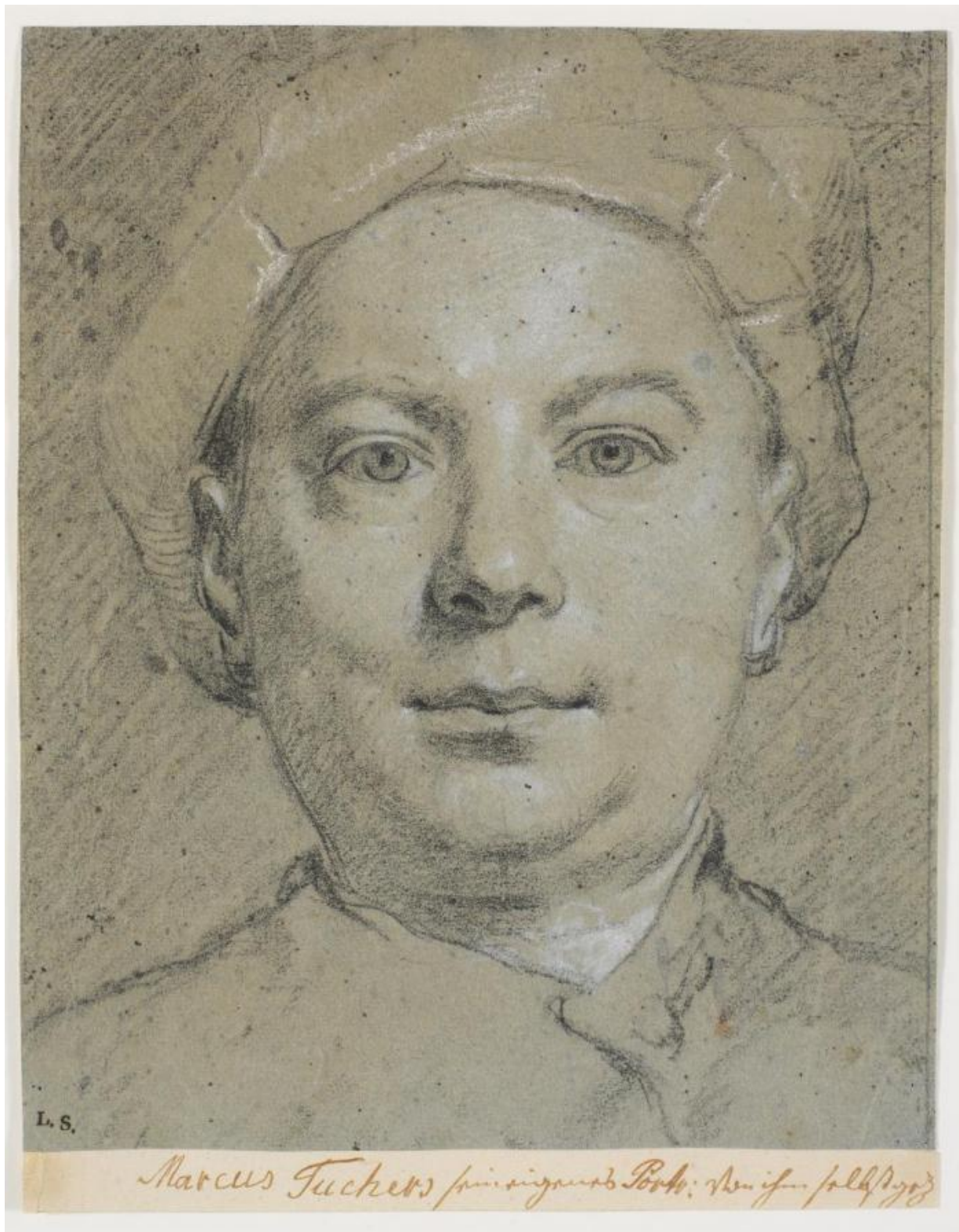
Fig. 5. Marcus Tucher: Selvportræt . Ca. 1740'erne. Sort og hvidt kridt på grågrønligt papir. 266 x 216 mm. Den kgl. Kobberstiksamling, KKSgb6375. Købt af Frederik 6. med Lorenz Spenglers samling i 1810; indgået i Den kgl. Kobberstiksamling ved dens oprettelse i 1835. Statens Museum for Kunst, public domain , SMK .