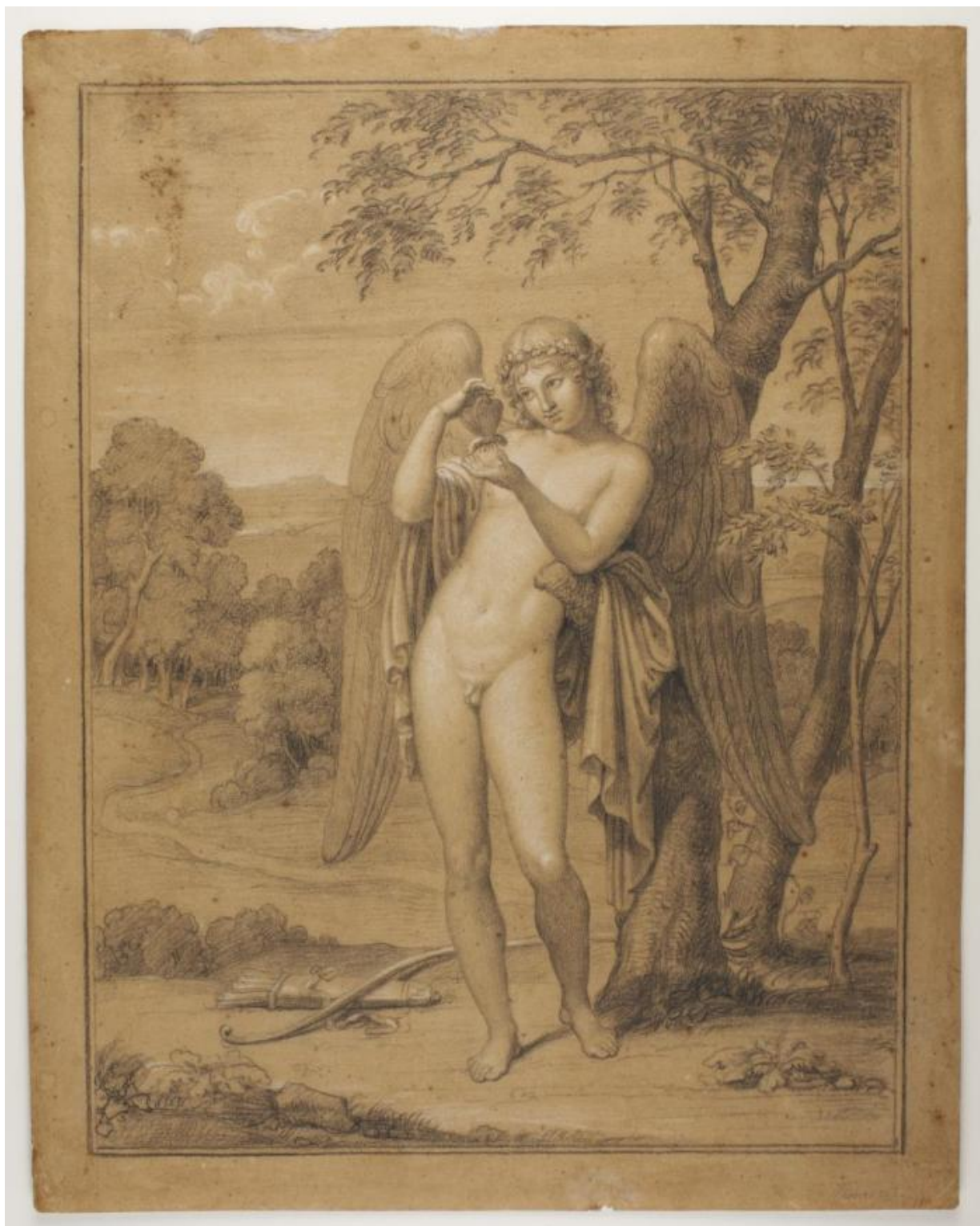
Fig. 13. Bertel Thorvaldsen: Amor leger med en sommerfugl . Ca, 1805-10. Sort kridt forhøjet med hvidt på lyst brunt papir. 421 x 333 mm. Den kgl. Kobberstiksamling, deponeret i Thorvaldsens Museum, Dep. 7. Købt af J.C. Spengler på Bülow's auktion i 1829 og indgået med Spenglers samling i 1840. Statens Museum for Kunst, public domain , SMK .

Mens Kunstakademiets tidlige tilløb til at skabe en offentlig samling af nationens tegnekunst altså snart forsvandt i glemelsen, så havde Kobberstiksamlingen ved indgangen til 1840'erne fuldstændig overtaget rollen som hovedsamling af danske tegninger. Blandt kunstnere blev den tanke snart helt naturlig, at deres skitser og studier kunne være af national betydning og institutionel interesse. Så da Johan Thomas Lundbye forud for sin store udlandsrejse i 1845 gjorde sig tanker om sit jordiske