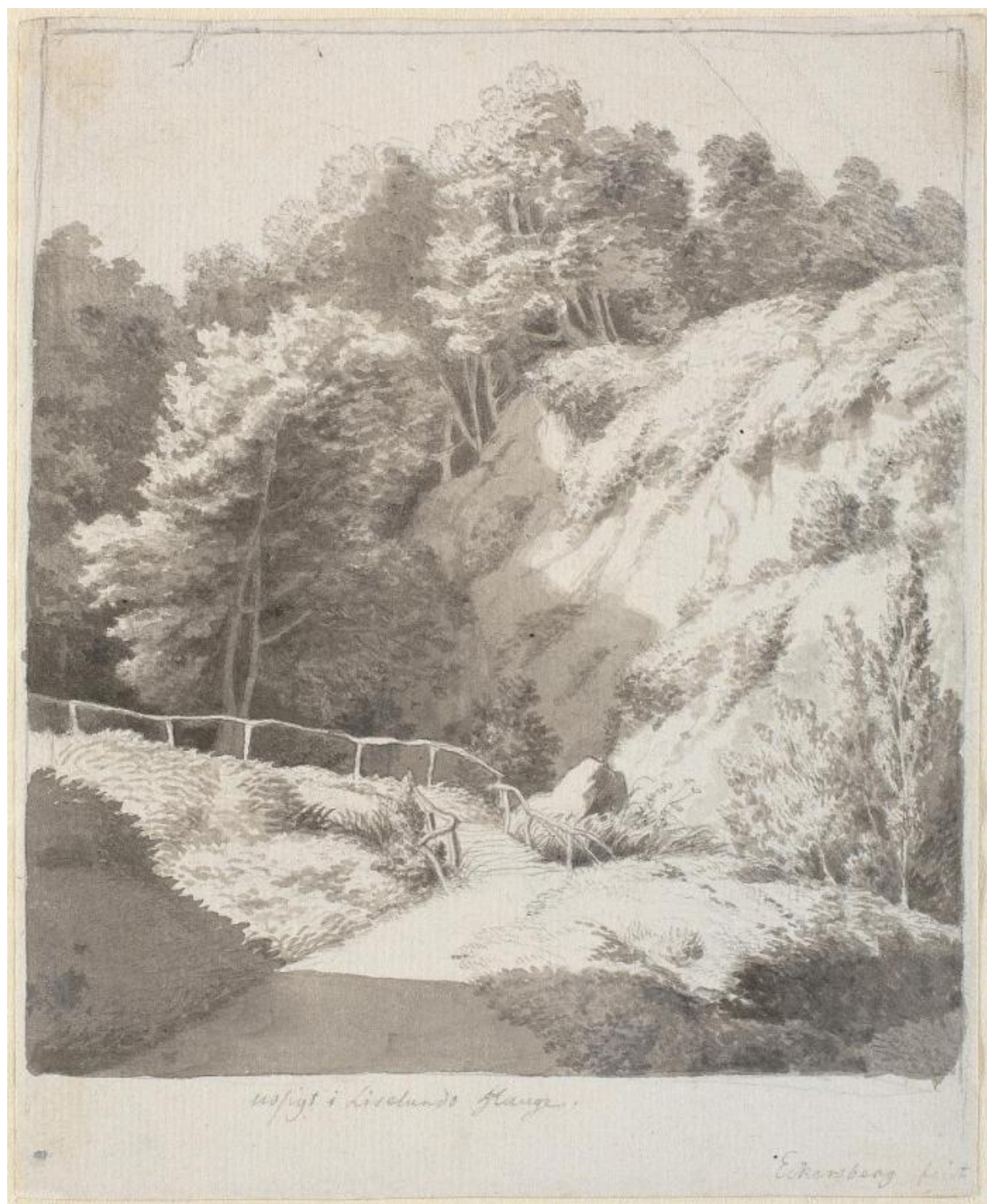
Fig. 2. C.W. Eckersberg: Udsigt i Liselunds have . Ca. 1809. Blyant, pen og blæk samt lavering. 191 x 155 mm. Den kgl. Kobberstiksamling, KKSgb4042. Købt til Kunstakademiet på Johan Bülow's auktion i 1829; overdraget til Den kgl. Kobberstiksamling i 1845.

bibliotekets chef, gehejmestatsminister Ove Malling (1748-1829), og havde i Werlauffs øjne den fordel, at biblioteket rimeligvis skulle kompenseres økonomisk af akademiet. I 1828 åbnedes derfor officielt forhandlinger med Kunstakademiet om salg af samlingen. 15