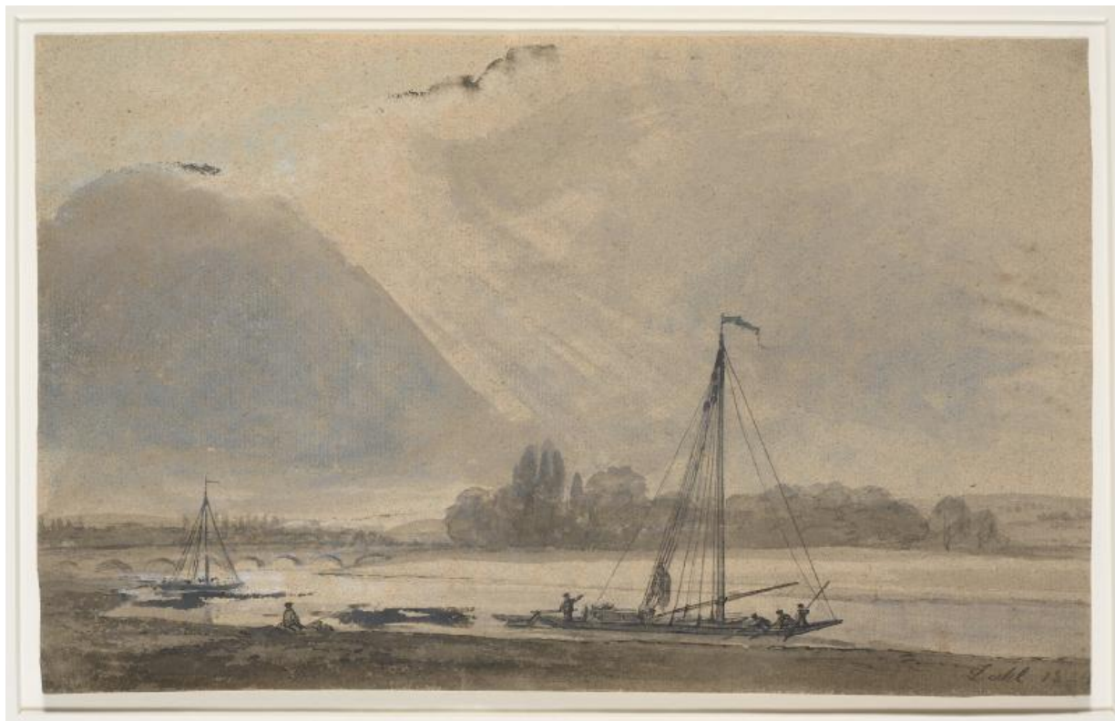
Fig. 12. J.C. Dahl: Parti af Elben nær Dresden . 1824. Pen og blæk, pensel og vandfarve. 215 x 343 mm. Den kgl. Kobberstiksamling, KKSgb4950. Købt af J.C. Spengler på Bülow's auktion i 1829 og indgået med Spenglers samling i 1840.