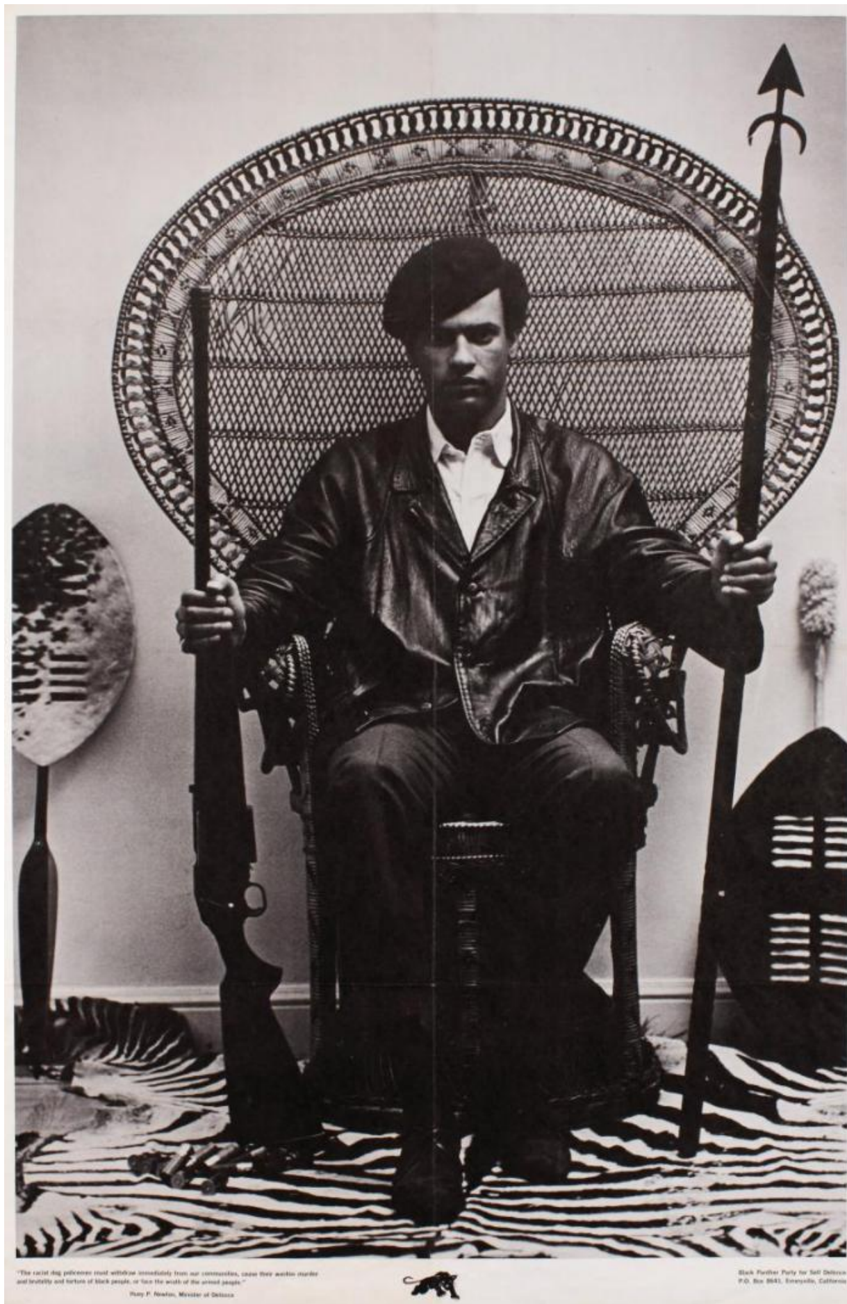
Fig. 5. Fotografi tilskrevet Blair Stapp, komposition af Eldridge Cleaver, Huey Newton siddende i en kurvestol, 1967. Litografi på papir. Collection of Merrill C. Berman.