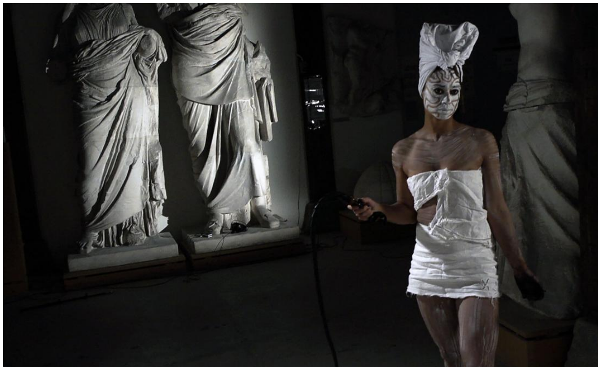
Fig. 3. Jeannette Ehlers, Whip It Good , 2014. Still fra videofilmet performance i Den Kongelige Afstøbningssamling, SMK. Whip It Good blev første gang kommissioneret af Art Labour Archives.