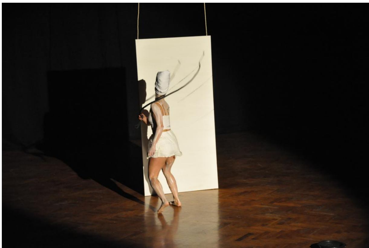
Fig. 1. Jeannette Ehlers, Whip It Good , 2013. Performance ved begivenheden 'BE.BOP: Decolonizing the "Cold" War' på teatret Ballhaus Naunynstraße, Berlin. Whip It Good blev første gang kommissioneret af Art Labour Archives og Ballhaus Naunynstraße.

I performancen Whip It Good (2013) [fig. 1] genopførte Ehlers en af slavetidens mest brutale former for afstraffelse – piskning – som en symbolsk handling. Hun iscenesatte transgenerationelle erindringer om slaveriets kropslige vold og undertrykkelse ved at piske et hvidt lærred med en pisk indsmurt i sort kul og afsluttede sin performance med at invitere det blandede publikum til at hjælpe hende med at "gøre arbejdet færdigt". [fig. 2] Whip It Good overskred på den måde flere grænser, inklusiv dem mellem performancekunst og kollektivt ritual, kunstnerens krop og tilskuernes kroppe, mellem "sorte" og "hvide" erfaringer, offer og gerningsmand. Performancen forbandt også kolonihistorie med en postkolonial kontekst og fraværende kroppe med tilstedeværende kroppe. Disse overskridelser sikrede, at genopførelsen ikke kun blev en simpel gentagelse af erindringer om en mørk fortid, men en forvandlerende handling. 34