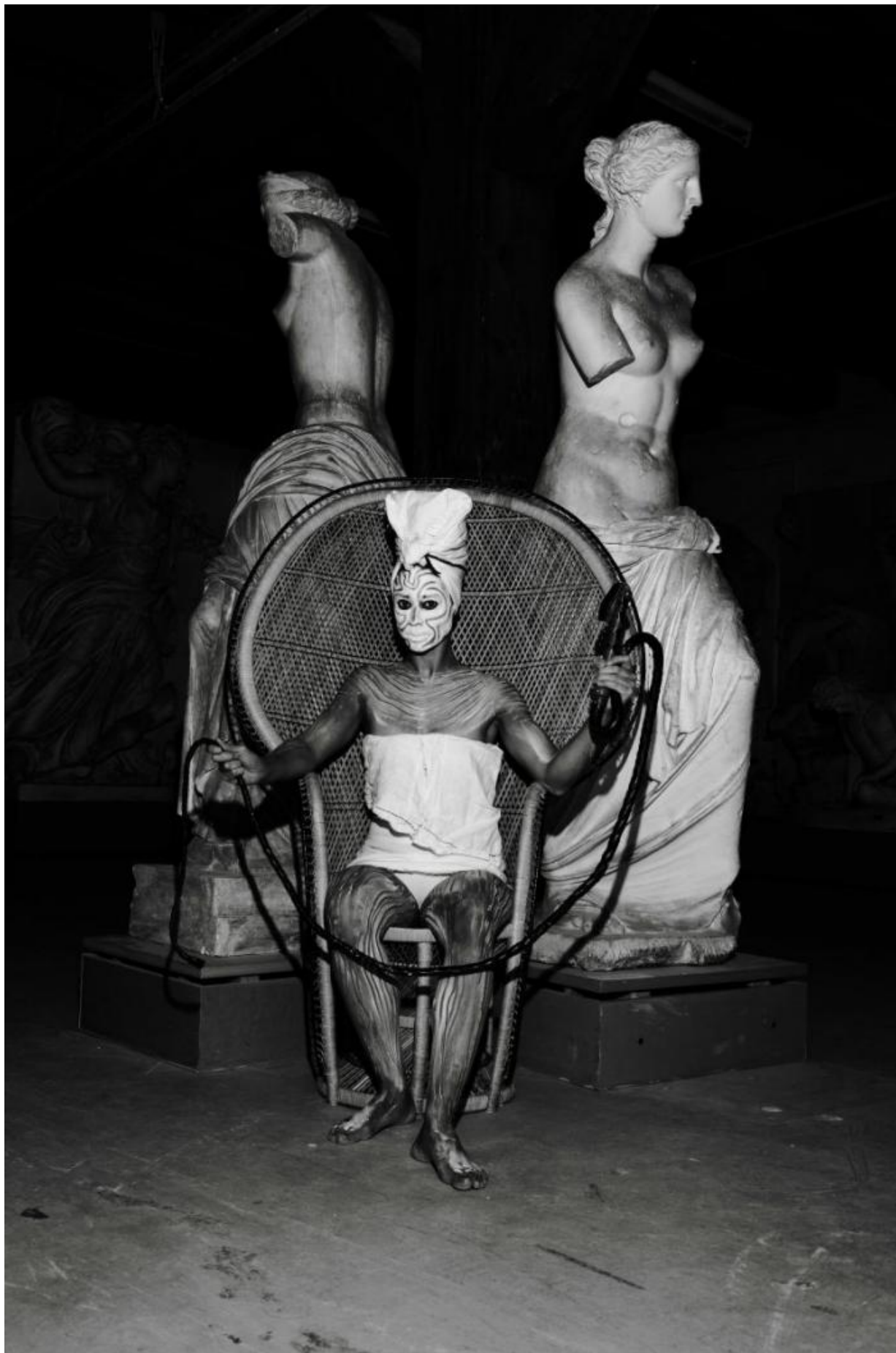
Fig. 4. Jeannette Ehlers, c-print fra optagelsen af Whip It Good i Den Kongelige Afstøbningsamling, SMK, 2014. Foto: Casper Maare. Med venlig tilladelse af kunstneren.